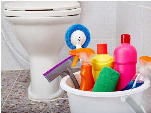
Toilet en douche

Is het toilet en de douche wel eens heel vies: