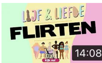
FLIRTEN | LIJF EN LIEFDE | AFLV 3