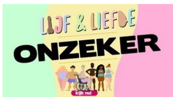
ONZEKER OVER JE LICHAAM LIJF EN LIEFDE | AFLV 12