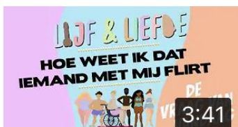
HOE WEET IK DAT IEMAND MET MIJ FLIRT | LIJF EN LIEFDE | DE VRAAG