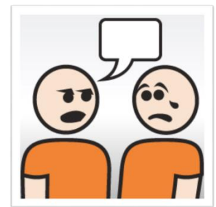
op elkaar mopperen