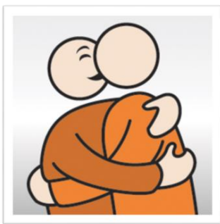
je omhelst elkaar