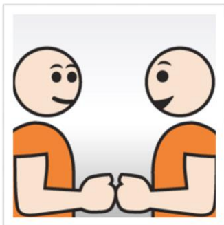
elkaar een box geven