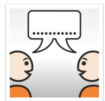
elkaar aankijken als je praat