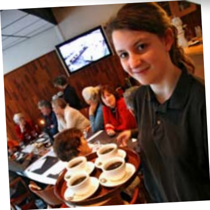
aan het werk