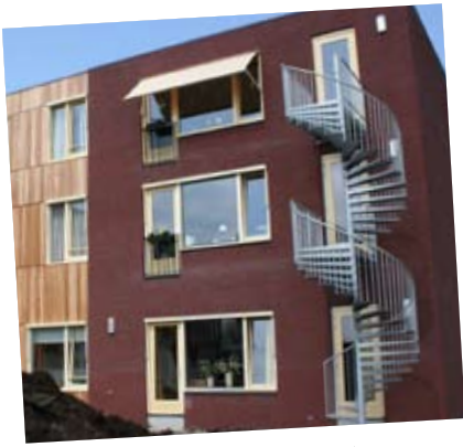
wonen met anderen