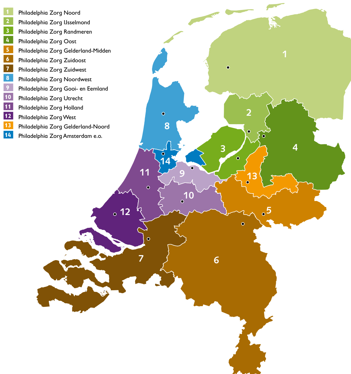
Figuur 2.3 Overzicht Philadelphia regio's

Voor de opbouw van de werkgebieden wordt verwezen naar onderstaand overzicht.